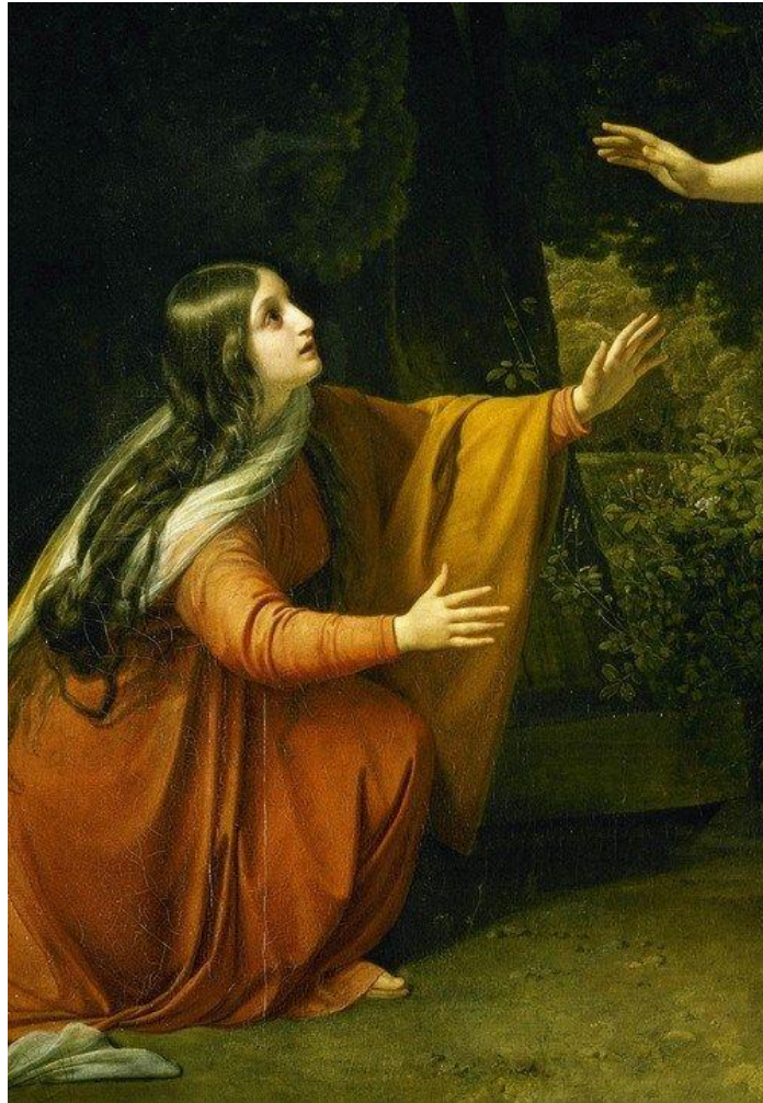
Alexander Ivanov 1835